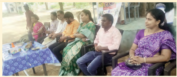
వేసవి శిక్షణా ముగింపు కార్యక్రమంలో పాల్గొన్న ఎంకాటి ఉపాధిపతి