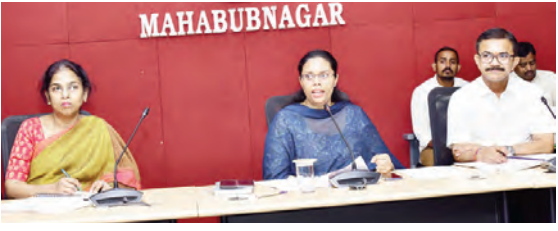
మాట్లాడుతున్న జిల్లా కలెక్టర్ ఖుష్నూ గుప్తా

మహబూబ్ నగర్ బ్యూరో, మే 29, ప్రభాతవార్త: జూన్ 2న నిర్వహించిన సన్న రాష్ట్ర అవతరణ దినోత్సవాన్ని వందల వాతావరణంలో ఘనంగా నిర్వహించాలని జిల్లా కలెక్టర్ ఖుష్నూ గుప్తా అధికారులను ఆదేశించారు. శుభవారం కలెక్టర్ కార్యాలయ సమావేశ మండలంలో నిర్వహించిన జిల్లా అధికారుల సమావేశంలో రాష్ట్ర అవతరణ దినోత్సవం సందర్భంగా చేపట్టాల్సిన ఏర్పాట్లు, కార్యక్రమాలపై అధికారులతో సమీక్ష సమావేశం నిర్వహించి ఆమె దిశానిర్దేశం చేశారు. కలెక్టర్ కార్యాలయం ప్రాంగణంలో నిర్వహించే జాతీయ పతాక ఆవిష్కరణ కార్యక్రమానికి సంబంధించిన పోలీస్ భద్రత, సీటింగ్ ఏర్పాట్లను, నీటి వసతి, నీడ కోసం బెంబుల ఏర్పాటు, తదితర విషయాలను పోలీస్, రెవెన్యూ డివిజన్ అధికారి, పరిపాలన అధికారి, మహబూబ్ నగర్ తహశీల్దార్, మున్సిపల్ శాఖ అధికారుల వరకు సమన్వయంతో ఎలాంటి లోపాపాట్లు లేకుండా నిర్వహించేందుకు చర్యలు తీసుకోవాలని ఆదేశించారు. జాతీయ పతాక ఆవిష్కరణ ముందుగా ఆర్ఆండ్వీ గెస్ట్ హౌస్ సమీపంలోని అమరవీరుల స్థూపం వద్ద గార్డ్ ఆఫ్ హోనర్ కార్యక్రమం ఉంటుందని అన్నారు. దానికి సంబంధించి స్థూపం అలంకరణ చేయడంతో పాటు వరిసర ప్రాంతాలను పరిశుభంగా ఉండేలా చూడాలని మున్సిపల్, ఆర్ఆండ్వీ శాఖ అధికారులను ఆదేశించారు. కార్యక్రమంలో పాల్గొనే విద్యార్థులు, ప్రజలకు తాగునీరు, నీడ సదుపాయాలు కల్పించాలని, వైద్య శాఖ అధికారులు ఓఆర్ఎస్ ప్యాకెట్లను అందుబాటులో ఉంచేలా తగిన ఏర్పాట్లను సూచించారు. రాష్ట్ర అవతరణ ఉత్సవం సందర్భంగా తీవ్ర ప్రభుత్వ శాఖల కార్యక్రమాలను ప్రజలకు వివరించేలా స్టాఫ్లను ఏర్పాటు చేయాలని కలెక్టర్ సూచించారు.